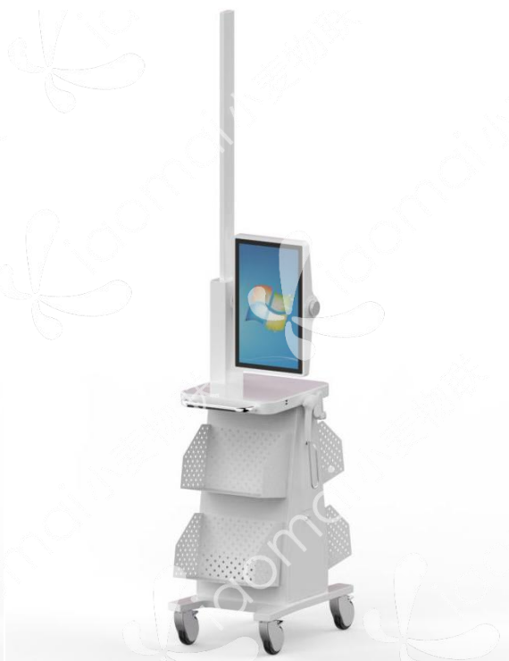
图 2 可升降智能盘点车（选配）