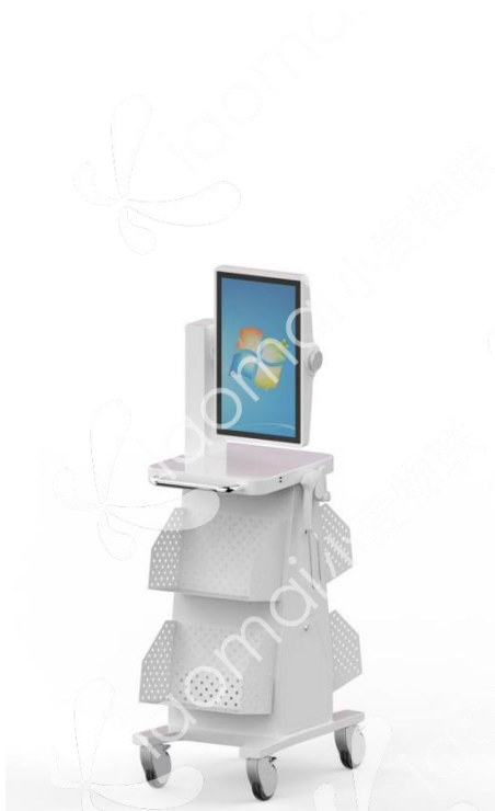
图 1 智能盘点车

设备配合 RFID 智能盘点系统，实现档案上架、下架、倒架、顺架、盘点、查找等功能，同时与密集架联动实现开架、闭架、通风、温湿度控制与显示等。