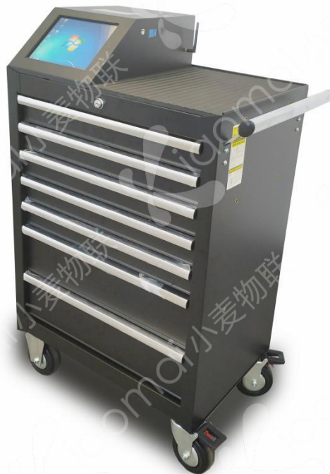
图 1 智能工具车

产品使用 10.4 寸工业触摸屏，Android 或 Windows 系统可选，可拓展指静脉、人脸、刷卡等登录方式；可定位到层，每层抽屉独立锁控，由软件自由组合开锁顺序；100A 大容量电池，支持 24h*3 天工作；5 秒内盘完整车 300 多把工具，识别准确率达 99.99%，可应用于轨道交通，电力巡检，智能制造，航空维修，智能工厂等应用场景，实现高度精确的智能化工具管理。